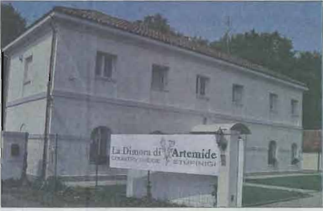
L'ex dimora dei guardiacaccia ristrutturata.

Il nome, la "Dimora di Artemide", richiama gli antichi fasti delle scene di caccia. E' il primo Country Lodge - Bed & Breakfast all'interno del Parco di Stupinigi. Il casolare che lo ospita è l'antica dimora dei guardiacaccia che è stata completamente e finemente ristrutturata. Di fronte c'è la "fagianaia", edificio ottocentesco dove un tempo venivano allevati i fagiani. Poco distante c'è il santuario di Vicomanino e l'omonimo cascinale anch'esso con un passato